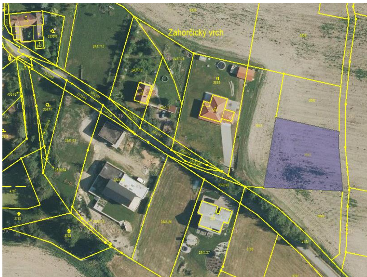
výřez z ortofotomapy s vyznačeným pozemkem, resp. rozšíření plochy B50

Co se týká úpravy textu v plochách Plochy výroby a skladování (VZ) – zemědělská výroba , tento byl upraven z důvodu jednoznačného určení, jaké stavby a zařízení lze realizovat ve správním území obce Vrábče.