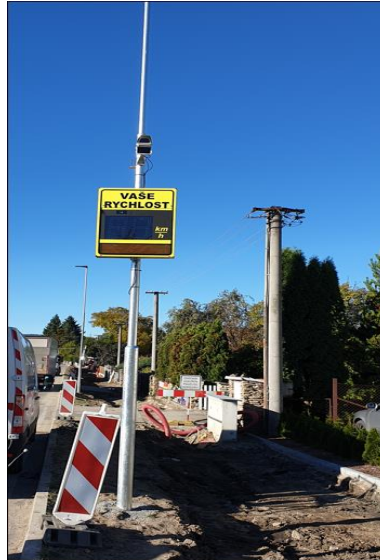
Foto našich radarů.

Vážení spoluobčané respektujme inteligentní ukazatel rychlosti.